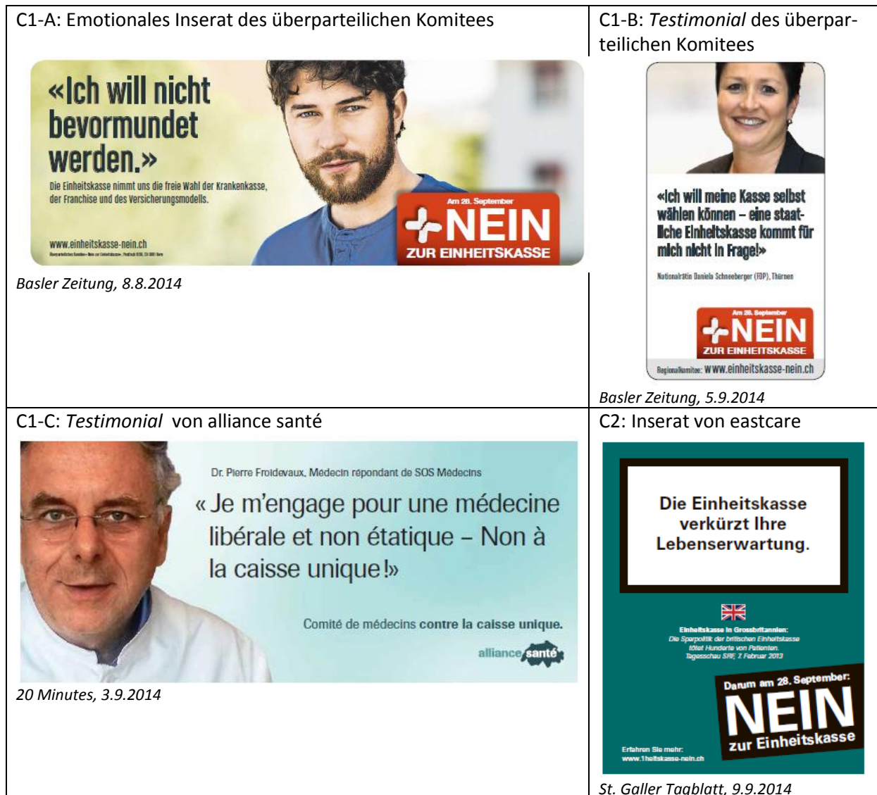
Abbildung 3.2: Illustrative Beispiele der wichtigsten Inseratetypen des Contra-Lagers

Aus den wichtigsten Inseratetypen der Initiativegegner geht hervor, dass das gegnerische Lager bereits auf Stufe des Wordings einen Akzent setzten wollte. Die Volksinitiative wurde nicht beim offiziellen Namen genannt. Mit der "Einheitskasse" gelangte vielmehr der Titel der Vorgängervorlage zur Anwendung, die im Jahre 2007 deutlich abgelehnt wurde.