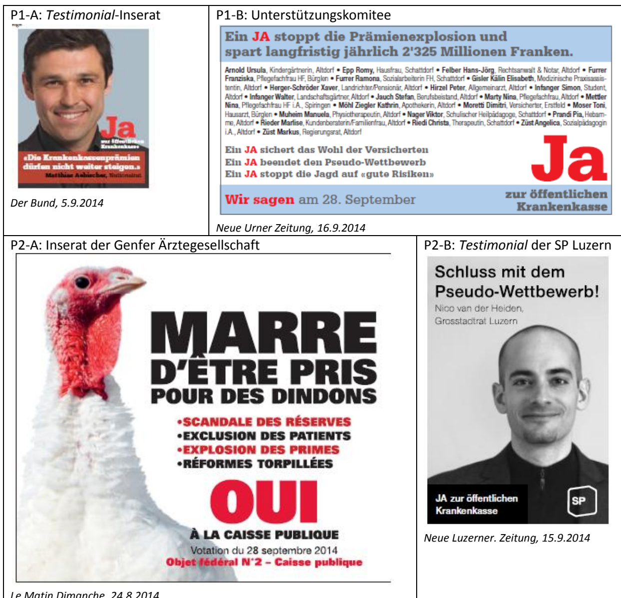
Abbildung 3.1: Illustrative Beispiele der wichtigsten Inseratetypen des Pro-Lagers

Die 58 erhobenen Inserate der Befürworter der öffentlichen Krankenkasse lassen sich nach in zwei Hauptkategorien aufteilen. In einer Mehrheit von 37 Fällen stammten diese vom Ja-Komitee „für eine öffentliche Krankenkasse“. Allerdings geht aus diesen Anzeigen nicht hervor, ob die Inserenten auf eidgenössischer oder kantonaler Ebene anzusiedeln sind. Der Umstand, dass sämtliche Inserate in Regionalzeitungen platziert wurden, deutet auf Letzteres hin. Jedenfalls waren in 35 Fällen Testimonials und nur in deren zwei herkömmliche Inserate anzutreffen. In der Abbildung 3.1 befindet sich jeweils ein Beispiel dieser zwei Typen (P1-A und P1-B).