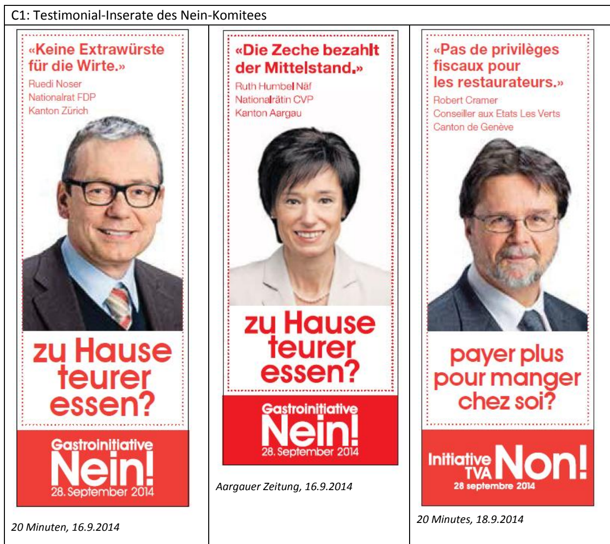
C1: Testimonial-Inserate des Nein-Komitees